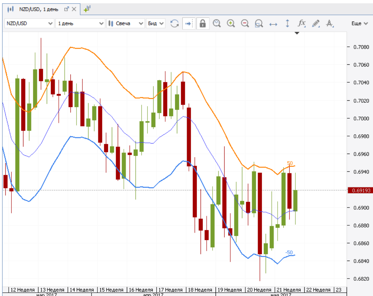
Рис. 1. Общий вид индикатора Envelope.

Индикатор "конверт", как и Bull Power и Bear Power , был предложен Александром Элдером. В задачах индикатора - помогать трейдеру определять места, когда цена максимально отстоит от своих средних значений.